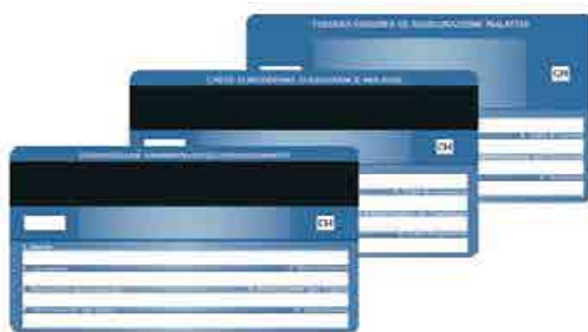
Carte européenne d'assurance maladie